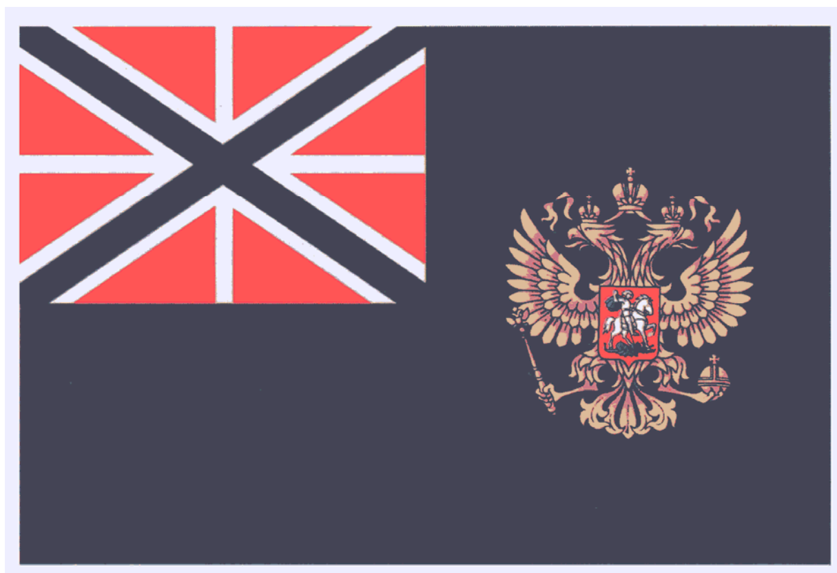
Рисунок флага директора Федеральной службы безопасности Российской Федерации (утв. Указом Президента РФ от 1 сентября 2008 г. N 1278)

Отношение ширины флага к его длине - два к трем. Отношение площади крыжа к площади флага - один к четырем. Отношение высоты орла к ширине флага - один к двум.