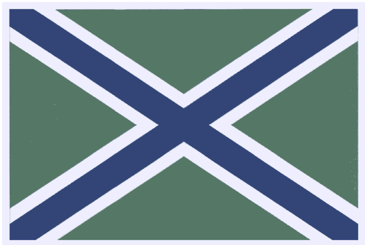
Рисунок флага кораблей, катеров и судов пограничных органов (утв. Указом Президента РФ от 1 сентября 2008 г. N 1278)

Отношение ширины флага к его длине - два к трем. Отношение ширины концов креста к длине флага - один к десяти. Отношение ширины белой каймы к ширине концов креста - один к двум.